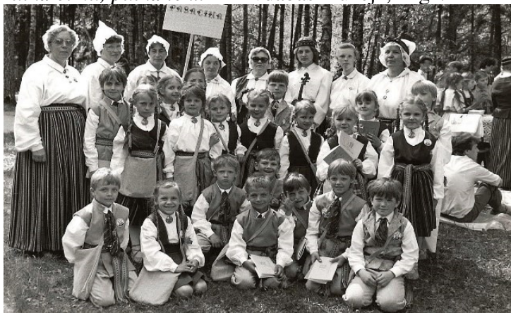
PII “Pasaciņa” mazie un lielie folkloristi /1990.05./