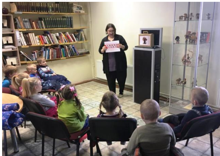
4.gadīgie pasacēni ir ļoti uzmanīgi klausītāji