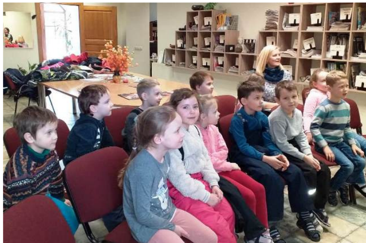
Patiešām labi pavadīts laiks!

Es nepacietīgi gaidu jaunu tikšanos ar bērniem, kuri ir paši labākie stāstnieki un ilustratori! Šī vienkāršā lieta – kartona kastīte ar ilustrāciju komplektiem - sevī ietver iespēju vingrināt runas un domas daudzveidību, valodas vārdu krājuma attīstību. Varam sagatavot īpašus uzdevumus ar noteiktu mērķi, varam vienkārši labi pavadīt laiku. Protams, mums šodien ir datori, projektori un “PowerPoint” prezentācijas, kam nenoliedzami ir sava loma un uzdevumi, bet no japāņiem aizgūtā, KAMIŠIBAI kastīte ir mazajam cilvēkam aptverams, darbināms un iztēli rosinošs instruments. Un iztēle urdās ne tikai mazajiem, arī es pētu internetā dažādas KAMIŠIBAI kastītes, lielākas un mazākas, domājot, ka derētu kaut ko papildināt, uzlabot, jo redzu, ka tas lieliski strādā!