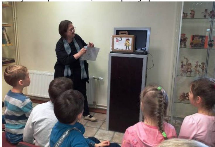
6-gadnieku pašu sacerēta un uzzīmētā pasaka “Par vienu zaķi, kurš prata skaitīt līdz 10”, arī aizrauj!

6.grupiņa, kā jau lielākie un varošākie, atnesa pašu zīmētu pasaku par skaitīšanu līdz 10. Es, protams, arī savas pasakas pastāstīju, bet, kad pie stāstījuma ķērās bērni, tad gan mēs piedzīvojām īstu teātri – bērni runāja “lomās”, savu stāstījumu bagātināja ar izteiksmīgiem žestiem, mācēja ieturēt pauzi, kad tas bija vajadzīgs, mācēja sakāpināt tekstu, kad to prasīja pasakas sižets!