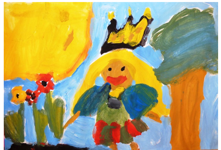
Zīmējuma autore Emīlija Kajaka /5.g.v./