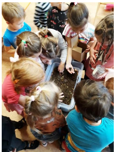
Pierakstīja Agita