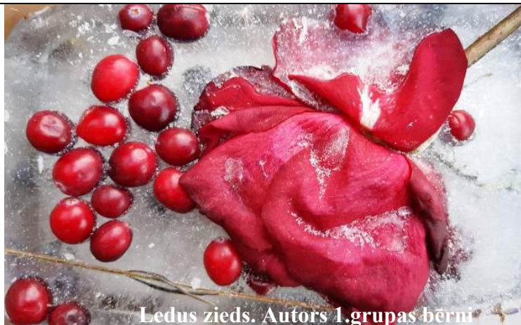
Ledus zieds. Autors 1. grupas bērni

No ziemas atvadās saulesstars un garu ģīmi ēnas tai rāda pēc atvadu brīža nāk pavasar's un rosās pie katra snaudoša stāda