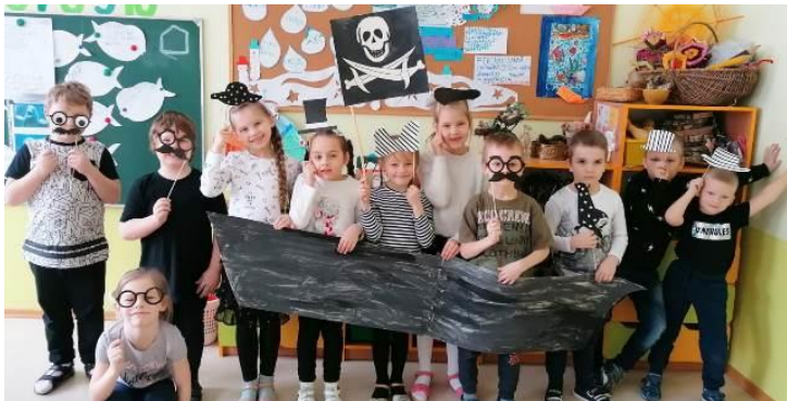
Melnraibā diena ar pirātisku piesitienu