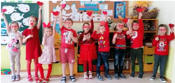
Sirsniņdiens jeb sarkanā pirmdienā...