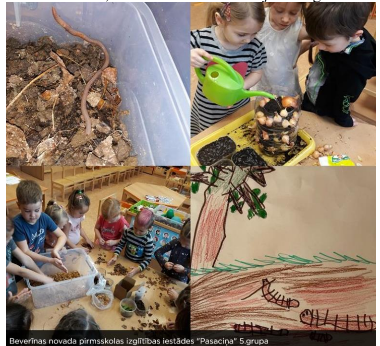
Beverīnas novada pirmsskolas izglītības iestādes “Pasaciņa” 5.grupa

Tika pētītas sliekas, radošās izpausmēs tās tika zīmētas un citādi atveidotas. Veidots komposts un tajā tās arī audzētas! Pētīti tika atkritumi un to sadalīšanās, aprokot tos rudenī un izrokot pavasarī. Secinājām, ka plastmasa, to aprokot, nekur nepazūd. Un radīts stāsts par sliekām un atkritumiem, kas nonākuši slieku mājās – augsnē.