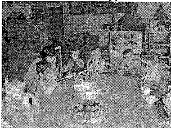
Edgara mamma lasītā pasaka...