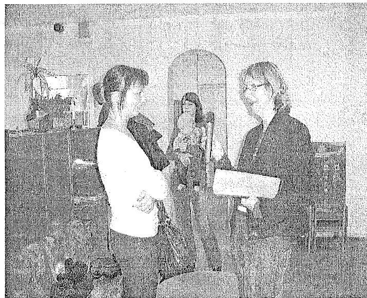
Ilonas Salnas foto