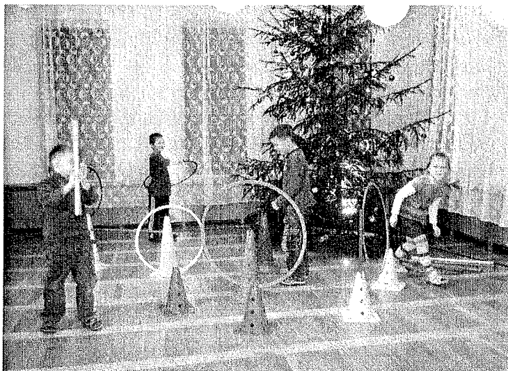
Tiek iemēģināts jaunais sporta inventārs stafetēm

Facebook: isv131313 Mājas lapa: logopedia.lv