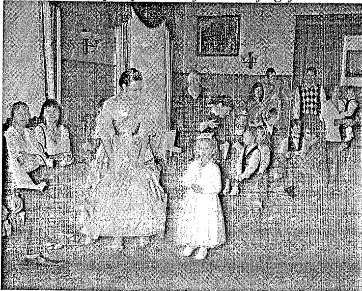
Ineses teksts un foto

Kopā ar Dikļu pils princesi ejam staltajā gājienā