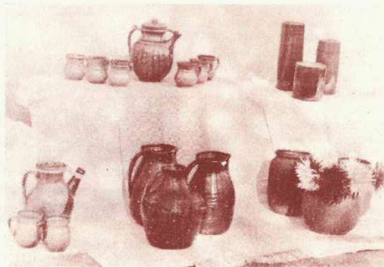
Lielā daļa mūsu ražojumu ir iekārtoti dāvināšanas priekšmeti, «Vaidavas» firmas veikalos keramikai ir labs noiets.