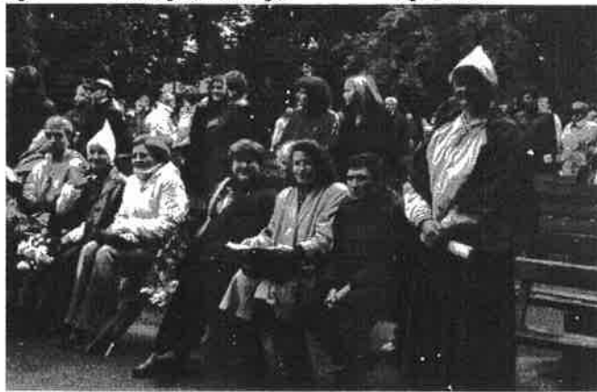
Akcijas atbalstītāji un organizētāji uz Vērmanīša skatuves.