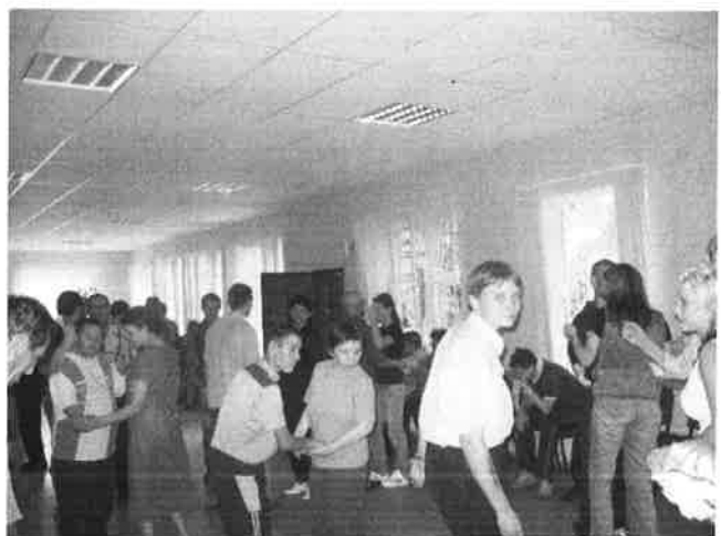
dienas noslēgumā pār gariem laikiem bija arī ballīte