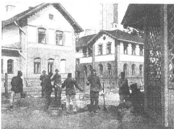
Teritorijas sakopšana kopā ar pacientiem