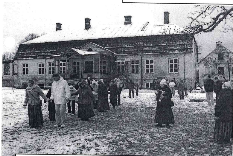
Folkloras kopa „Dzīne „ aicina visus padejot