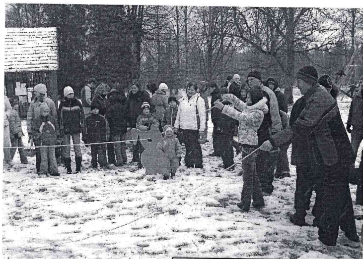
Mazo zaķīšu dīdīšana