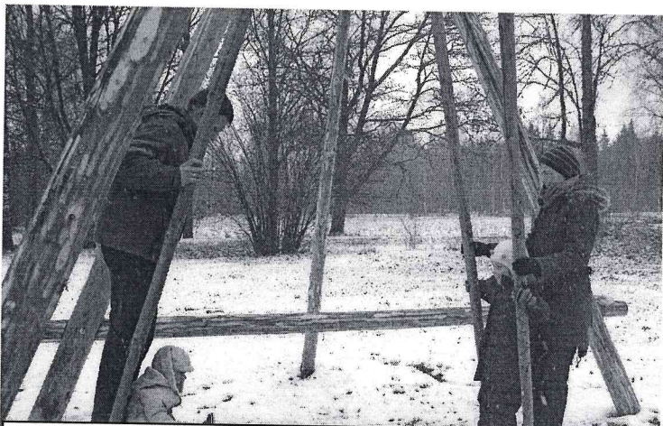
Oleru muižas saimnieki iešūpo Lieldienu šūpoles