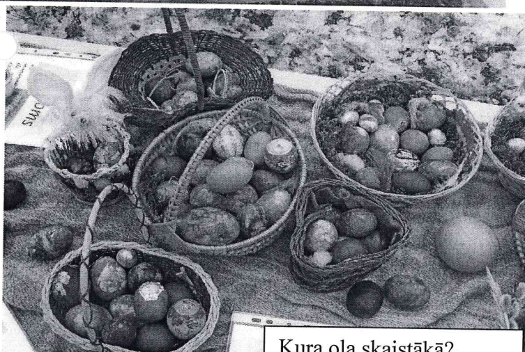
Kura ola skaistākā? .....