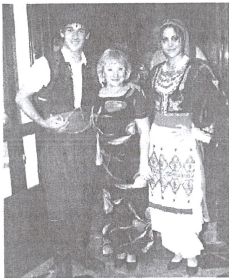
Attēlā esmu kopā ar grieķu meiteni un zēnu

15 reīzu vairāk. Dzīvojamās mājas tiek celtas trīs stāvos, - pirmajā stāvā parasti ir iekārtota taverna vai kāds veikaliņš, otrais un trešais stāvs dzīvošanai. Visa pilsēta strādā pamatā tūrisma industrijā. Krētieši saka, ka viņiem ir divi gadalaiki- vasara un ziema. Ziema ilgst trīs mēnešus, kad ir lietāvas un vēji. Ziemā vietējie iedzīvotāji slēdz savus veikaliņus, kafējnīcas un dodas novākt vīnogas un olīvas. Jau vairākus tūkstošus gadu grieķu virtuve balstīta uz olīveļļu. Olīvkoks tiek uzskatīts par svētu koku, jo šis koks bijis iestādīts jau senākajos laikos un to darījusi gudrības dieviete Atēna. Sens ticējums uzliek katram jauniešiem pienākumu, iestādīt olīvkociņu un rūpēties par to līdz tas izaudzis. Pirms daudziem gadsimtiem, kad notika kari, drīkstēja nogalināt cilvēku, bet nocirst olīvkoku skaitījās liels grēks.