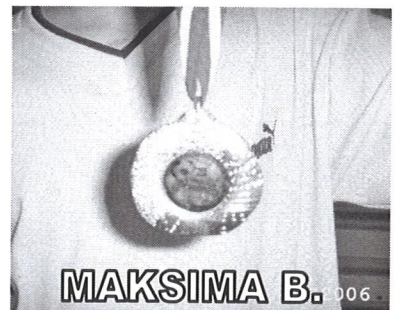
MAKSIMA B. 006