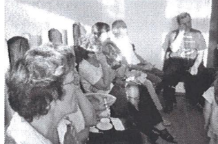
Foto no 30.septembra semināra par Sedas attīstību