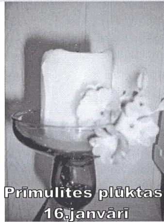
Prīmulītes plūktas 16.janvārī

Nobirst svētku eglei skujas, Jāsavāc sveciņu izdeguļi, Svētku drānas ieliktas skapī, Tālāk pa ikdienu kulies.