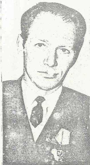
NESEN ĒRIKS KRASTIŅŠ SAŅĒMA LATVIJAS KP CENTRĀLĀS KOMITEJAS, MINISTRU PADOMES, AROD- BIEDRĪBU REPUBLIKĀNISKĀS PADOMES UN LEKĀS CK GODA ĻĀKSTU UN BALVU PAR UZVARU SOCIĀLISTISKAJĀ KĀRĒNĪBĀ 1973. GADĀ