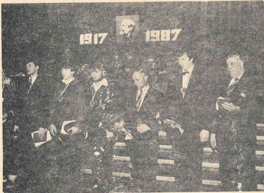
Ražas svētkos.