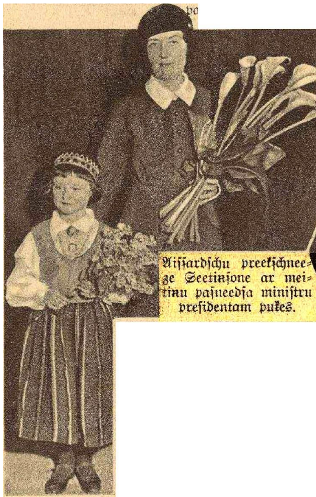
Aizsardžu priekšnieces Sietiņsones 6 g. vecā meitiņa prezidentam pasniedza ziedus. 1936. Valmieras apriņķa 15. zemnieku dienā

Latvijas laikā vecāmamma bijusi īsta Dāma, Aizsardžu priekšniece. No šī laika avīzēs saglabājusies fotogrāfija, kur mazā Sarmīte pasniedz ziedus Kārlim Ulmanim. Par šo notikumu Valmierā avīzes vēsta: “Plkst. 3 p. pusd. Latviešu biedrības pārpildītā zālē notika Valmieras apriņķa 15. zemnieku diena, uz kuru ieradušies visi Valmieras apriņķa pagastu vecākie un ļoti daudzi tuvākās un tālākās apkārtnes zemnieki. Zāle bija greznota zaļumiem un valsts karogiem. No ieejas līdz zāles vidum spaljeros stāvēja aizsargi. Pie ieejas biedrības namā ministru prezidentam, izglītības ministram un Baltijas lauksaimniecības biedrības priekšniekam pasniedza ziedus. Ministru prezidentam ienākot zālē, atskanēja vētraini aplausi, un Baltijas lauksaimniecības biedrības biškopības nodaļas koris dziedāja Vadoņa suminājumu. Aizsardžu priekšnieces Sietiņsones 6 g. vecā meitiņa prezidentam pasniedza ziedus.” 13